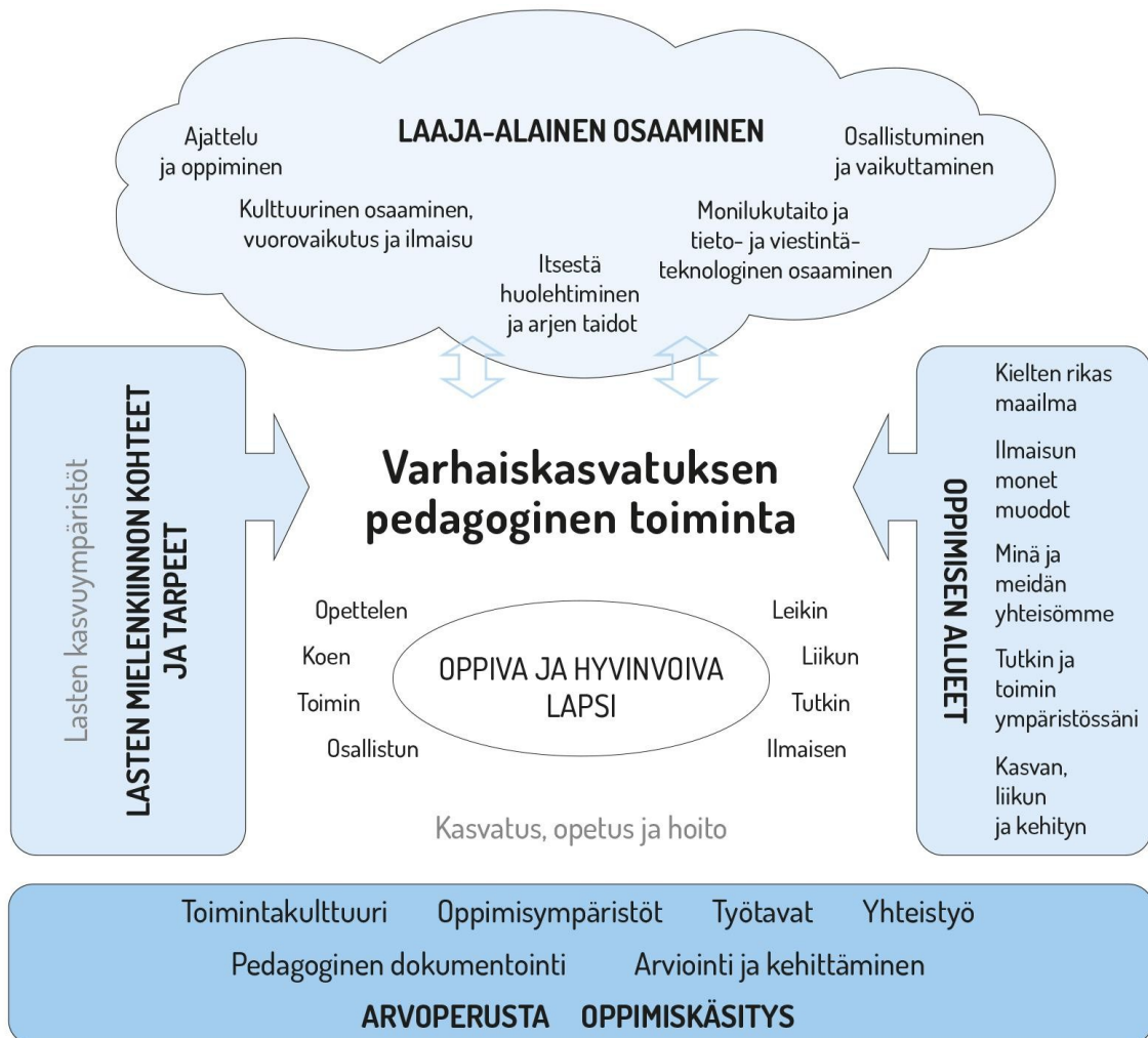
Kuvio 1. Varhaiskasvatuksen pedagogisen toiminnan viitekehys

Varhaiskasvatuksen pedagogista toimintaa ja sen toteuttamista kuvaa kokonaisvaltaisuus. Tavoitteena on edistää lasten oppimista ja hyvinvointia sekä laaja-alaista osaamista (kuvio 1). Pedagoginen toiminta toteutuu lasten ja henkilöstön välisessä vuorovaikutuksessa ja yhteisessä toiminnassa. Lasten omaehtoinen, henkilöstön ja lasten yhdessä ideoima sekä henkilöstön johdolla suunniteltu toiminta täydentävät toisiaan. Varhaiskasvatuksen pedagoginen toiminta läpäisee kasvatuksen, opetuksen ja hoidon kokonaisuuden.